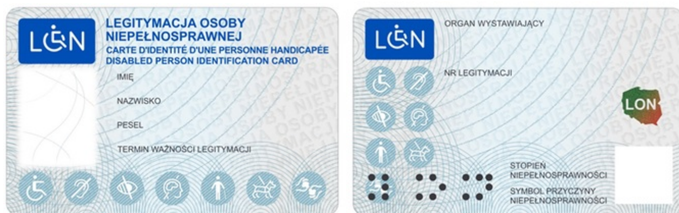
Wzór legitymacji dokumentującej niepełnosprawność